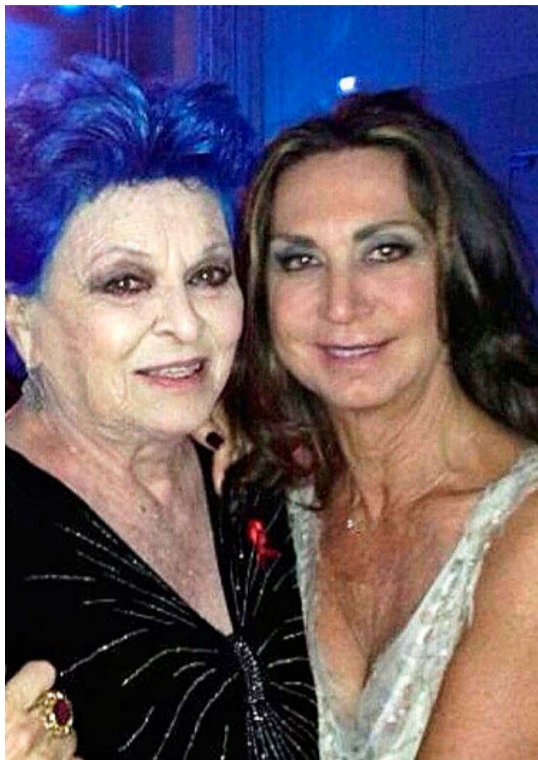
Nuria Amat con Lucía Bosé.