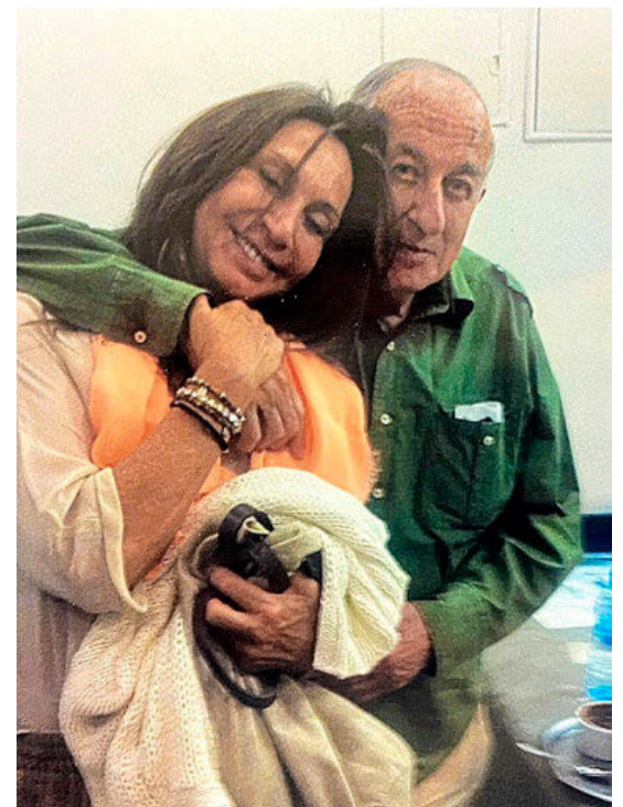
También disfrutó de la amistad de Goytisolo. E.M.