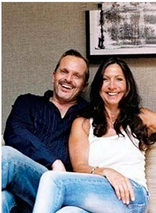
Miguel Bosé, un gran amigo.